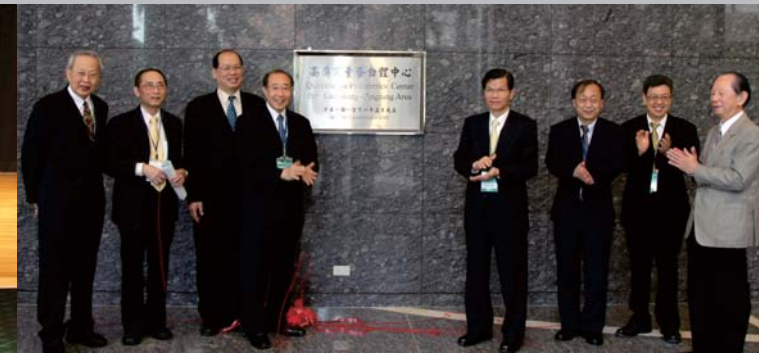
101年5月28日邀請中研院翁啟惠院長共同主持 「高屏定量蛋白體中心」揭牌儀式